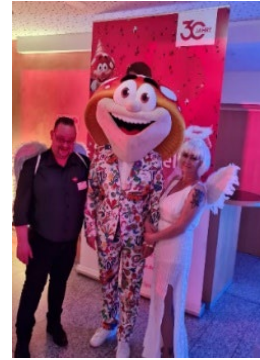
Winni passt perfekt in den Wald bei Pflanzaktionen... ...oder als Glücksbringer bei Single-Partys...