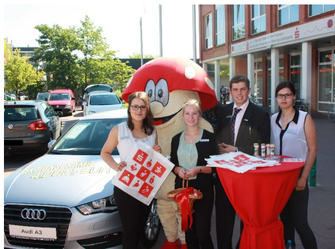
Aktion vor der Geschäftsstelle