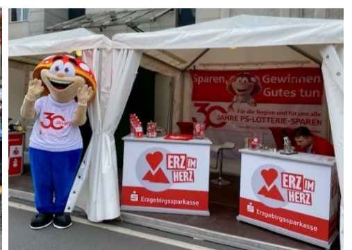
Winni erzeugt Aufmerksamkeit bei Stadtfesten und regionalen Highlights...