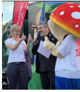
...manchmal auch aktiv bei Firmenläufen.